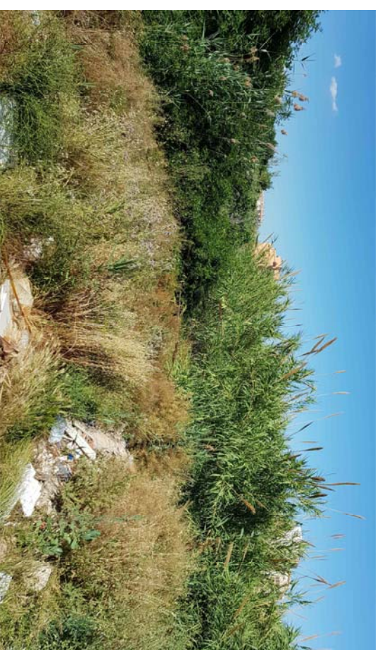
Ortofoto y Fotografía